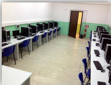
SCUOLA SECONDARIA I GRADO PLESSO FISICARA

Nell'aula multimediale vi sono 16 postazioni fisse in rete tra loro, una stampante laser b/n e colori 3 portatili per l'uso della LIM e collegamento a INTERNET+ WI-FI e 2 video proiettori. Tutte le classi utilizzano l'aula multimediale per attivare abilità e consolidare capacità legate alle diverse discipline scolastiche.