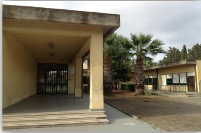
SCUOLA PRIMARIA PLESSO FISICARA