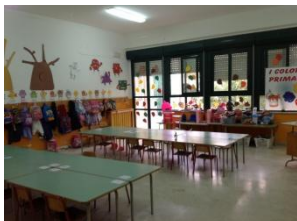
SCUOLA INFANZIA PLESSO FISICARA