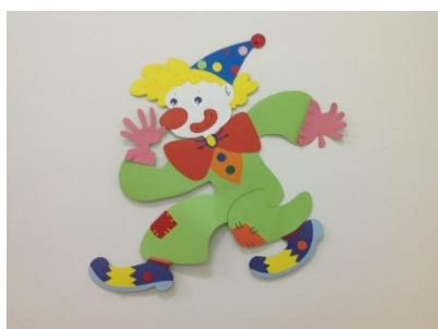
SCUOLA INFANZIA EX-ONMI