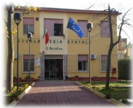
SCUOLA SECONDARIA I GRADO CENTRALE

Tempo normale + corso ad indirizzo musicale